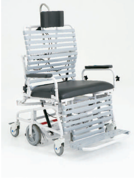
5'Ej c kug'gp 'wp g#