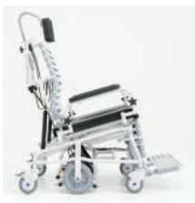
14° bascule arrière