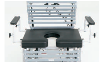
l'ouverture frontale du siège facilite la toilette du périnée

appuie-bras réglables en largeur jusqu'à 33" 83 cm