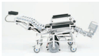
65° inclinaison du dossier

appuie-bras réglables en largeur jusqu'à 33" 83 cm