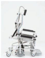
8° bascule avant